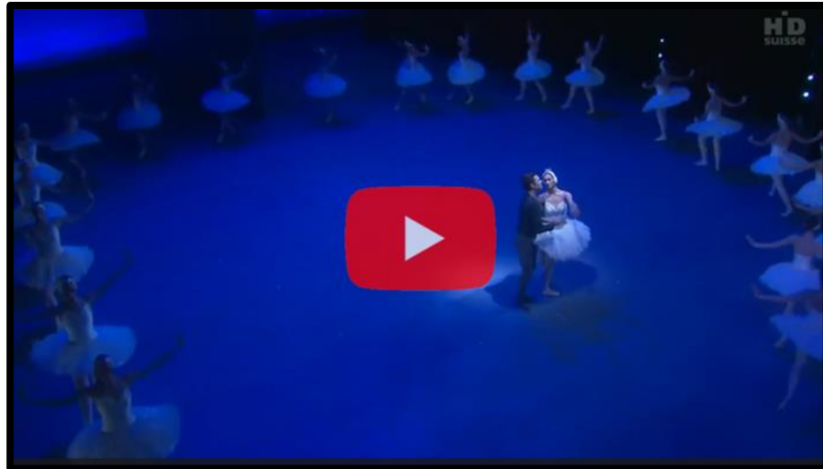
Vídeo: El Lago de los Cisnes

No te lo pierdas, y disfruta esta maravillosa obra con unos buenos auriculares.