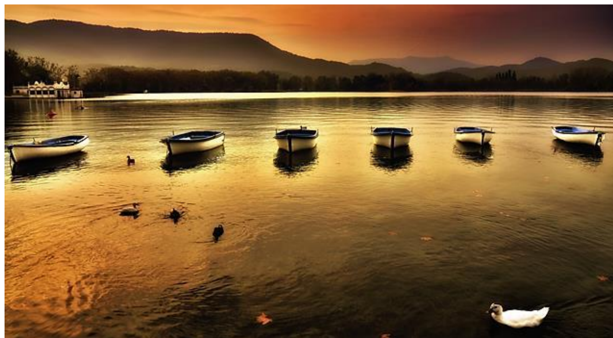
FOTOGRAFÍA: EN EL ESTANQUE DORADO. JOSE LUIS MIEZA.

La Fundación Aurora es una entidad sin ánimo de lucro cuyo objetivo es motivar a toda la sociedad civil para transmitir nuestra cultura a los niños y jóvenes de 7 a 15 años.